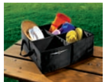
ORGANIZER VOOR BAGAGERUIMTE

Rubberen slijkmatten in kleur, met diepe ribbels om water, sneeuw en modder vast te houden en uw vloer te beschermen en schoon te houden. In elk seizoen een must bij slecht weer.