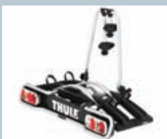
FIETSENDRAGER VOOR TREKHAAK

Verticale bevestiging of vorkbevestiging. Voor sportfiets of mountain-bike. Houder voorwiel apart verkrijgbaar.