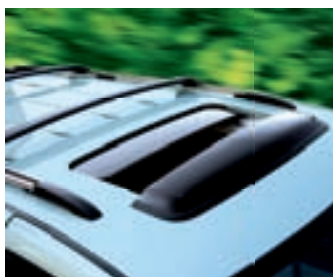
WINDDEFLECTOR VOOR OPEN DAK

De afdekhoes beschermt de lak van uw auto tegen uv-stralen, vuil en verontreinigende stoffen in de lucht. Gemaakt van hoogwaardig, zwaar materiaal dat wasbaar, luchtdoorlatend en waterbestendig is. De afdekhoes is precies op maat van de Grand Voyager gemaakt. Ze heeft dubbele naden en voor- en achteraan elastische randen onderaan. Standaard voorzien van een venstertje voor de nummerplaat achteraan, veteroogjes en pasvormen voor de spiegels.