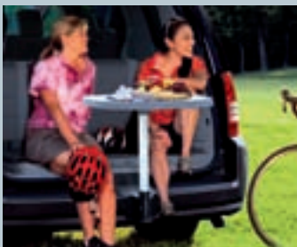
TAFELTJE VOOR ACHTERAAN

Wordt achteraan op de Grand Voyager gemonteerd, om volop van uw uitstapjes te genieten.