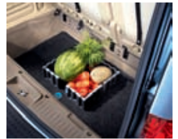
KOFFERMAT MET VELCROVAKKEN

De bagageruimtebak in dichtgeweven nylontapijt heeft opstaande randen om de bagageruimte te beschermen tegen vloeistoffen, vuil en vet. De bak heeft precies de vorm van de bagageruimte. Toch kan hij in één oogwenk worden geplaatst of weggenomen voor reiniging. De kleur past stijlvol bij het interieur. Ook voorzien van Cargo Loks die verhinderen dat losse voorwerpen op de vloer rondslingeren. De Cargo Loks zijn gemaakt van slagbestendige thermoplastische kunststof. Afhankelijk van uw behoeften kunt u de bak in vakken indelen met velcrohaken die stevig vasthaken in de bodem.