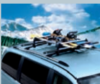
DUBBELE SKI- EN SNOWBOARD – DRAGER

Vervoert kajaks, zeilplanken of surfplanken. Een veerslot en nylon riem houden het vaartuig stevig op zijn plaats.