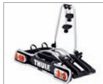
FIETSENDRAGER VOOR TREKHAAK

Geschikt voor dakkoffers, fietsen-dragers, enz... Ook verkrijgbaar voor dakrails (300C Touring).