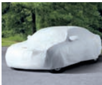
COVERHOES VOOR WAGENS

Geeft een totaal andere look aan de 300C en respecteert alle technische verplichtingen (luchtinlaat).