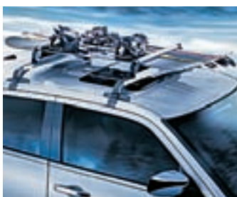
DUBBELE SKI- EN SNOWBOARD-DRAGER

Deze stevige, afsluitbare thermo-plastische dakkoffer houdt de lading droog en veilig, ongeacht de weersomstandigheden. Gemakkelijk te installeren en voorzien van een openingsstelsel met vering. Verkrijgbaar in twee modellen: Korte dakkoffer 440 l (151 cm L x 100 cm B x 41 cm H, 20kg). Lange dakkoffer 480 l (228 cm L x 70 cm B x 41 cm H, 25kg).