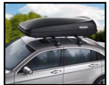
COFFRE DE TOIT

Permettent d'installer coffres de toit, porte-vélos, etc.