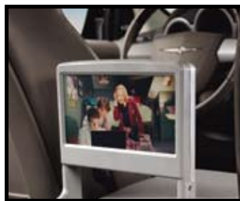
SYSTÈME MULTIMÉDIA DVD

Empêchent l'eau, la boue et autres saletés de souiller le sol. Très faciles à nettoyer.