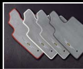
TAPIS DE SOL PREMIUM

Amovible, il s'intègre parfaitement au châssis et autres éléments mécaniques de la Sebring. Kit électrique vendu séparément.