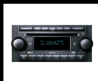
RADIO PREMIUM RAR