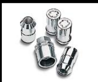
SYSTÈME ANTIVOL POUR ROUES

Set de quatre boulons antivol pour jantes en alliage léger.