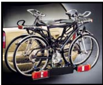
PORTE-VÉLO POUR ATTACHE-REMORQUE

Pour deux vélos, socquet 7/13 fiches inclus.