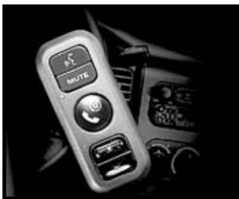
KIT MAINS-LIBRES BLUETOOTH™

Le kit mains-libres Bluetooth™ est un système embarqué de communication cellulaire mains libres à activation vocale qui se compose d'un tableau de commande et d'un micro. Donnez et recevez des appels téléphoniques grâce au micro et au haut-parleur, sans avoir à brancher des fiches ou des fils sur votre appareil. Nécessite un GSM avec technologie Bluetooth™.