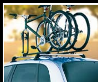
PORTE-VÉLO DE TOIT

Set de quatre boulons antivol pour jantes en alliage léger.