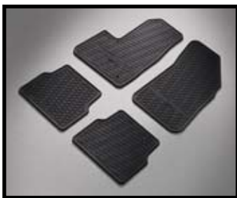
TAPIS DE SOL EN CAOUTCHOUC

Empêchent l'eau, la boue et autres saletés de souiller le sol. Très faciles à nettoyer.