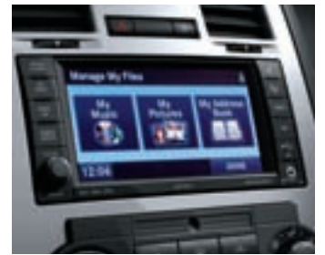
SYSTÈME UCONNECT NAV

Ce système multimédia est géré par un écran tactile de 165 mm et par reconnaissance vocale en six langues. Outre le combiné audio stéréo AM/FM/cd/dvd/mp3, il comporte un disque dur de 30 Go capable de stocker et de classer sous forme de playlists jusqu'à 6.700 fichiers musicaux, téléchargeables depuis le lecteur cd, le port USB ou le connecteur pour le lecteur mp3 en façade. La lecture des fichiers son et image ainsi que la sélection des stations de radio sont commandées via l'écran tactile. Le système de navigation multimédia (Uconnect GPS), également disponible, regroupe les mêmes fonctions ainsi qu'un système de navigation plein écran avec canal d'infos trafic TMC. Il se complète d'un système de communication mains libres Uconnect à commande vocale (Uconnect phone). Ce système embarqué compatible avec votre téléphone Bluetooth™ est également proposé indépendamment du système multimédia.