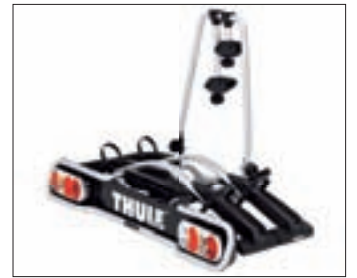
PORTE-VÉLO POUR ATTACHE-REMORQUE

Permettent d'installer coffres de toit, porte-vélos, etc. Egalement disponible pour le montage sur les rails de toit (300C Touring).