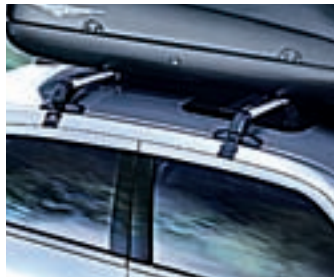
BARRES DE TOIT

Permettent d'installer coffres de toit, porte-vélos, etc. Egalement disponible pour le montage sur les rails de toit (300C Touring).