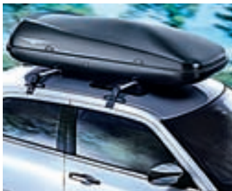
COFFRE DE TOIT

Porte-vélo pour deux vélos, socquet 7/13 fiches inclus.