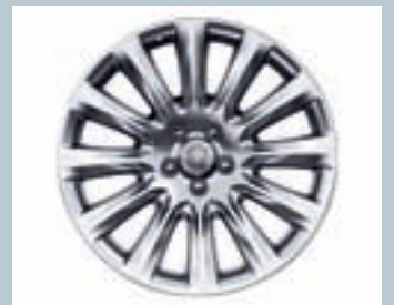
JANTES 8 X 20" EN ALUMINIUM