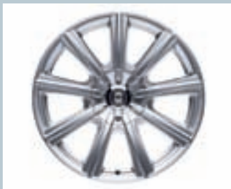
JANTES 7.5 X 18" EN ALUMINIUM