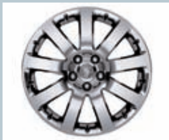
JANTES 7.5 X 18" EN ALUMINIUM CHROMÉ