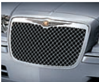
CALANDRE NID D'ABEILLE

Donne un look totalement différent à la 300C et respecte toutes les exigences techniques requises (prise d'air).